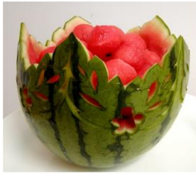
透かし(どなたでも)