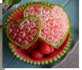
スイカ10ハートバスケット