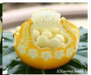
ネット16フルリアの器