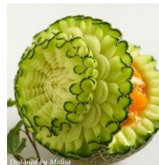
ネット18 左右ひねり