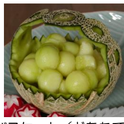
バスケット(どなたでも)