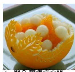
器9.葉模様の器 (3回以上)