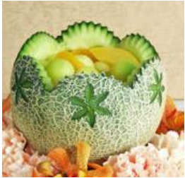
花の器(どなたでも)