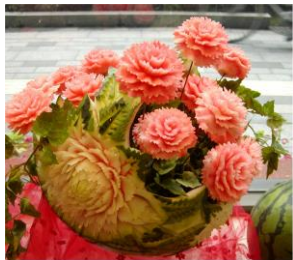
スレ13 花のバスケット