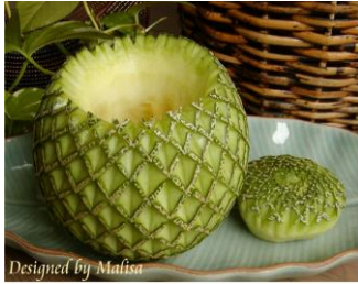
ネット刈ソVカット