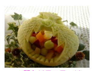
器クリスマスツリ

黒の文字10回以上 ピンクの文字20回以上 グリーンの文字30回以上 ブルーの文字40回以上